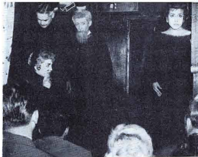
EL TEATRO Popular del INBA se creó en 1956 EXISTEN 18 grupos en constante actividad. UNA ORIENTACIÓN social y cultural bien definida.