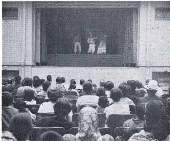
LOS GRUPOS adquieren una útil experiencia. SE LOGRA una valiosa proyección didáctica. DESDE EL sainete mexicano hasta los clásicos.