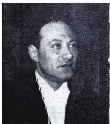
EL DIRECTOR René Leibowitz.