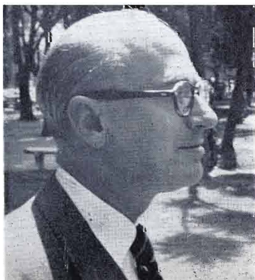
MAESTRO Rodolfo Halffter.

La importancia de los Conciertos de Bellas Artes consiste, principalmente, en el nuevo sentido que se ha querido dar a esta ya tradicional temporada: poner en contacto al público melómano con el arte musical actual. En esta forma se realiza una más de las finalidades de difusión cultural del I.N.B.A.