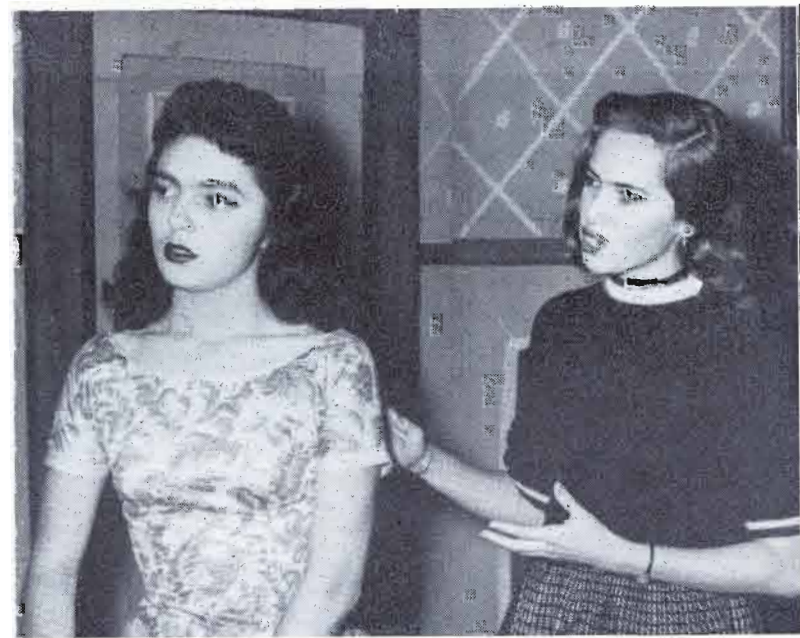
EN LA provincia están las mejores reservas de México. EL MÉRITO radica en que son fruto ya de la provincia.