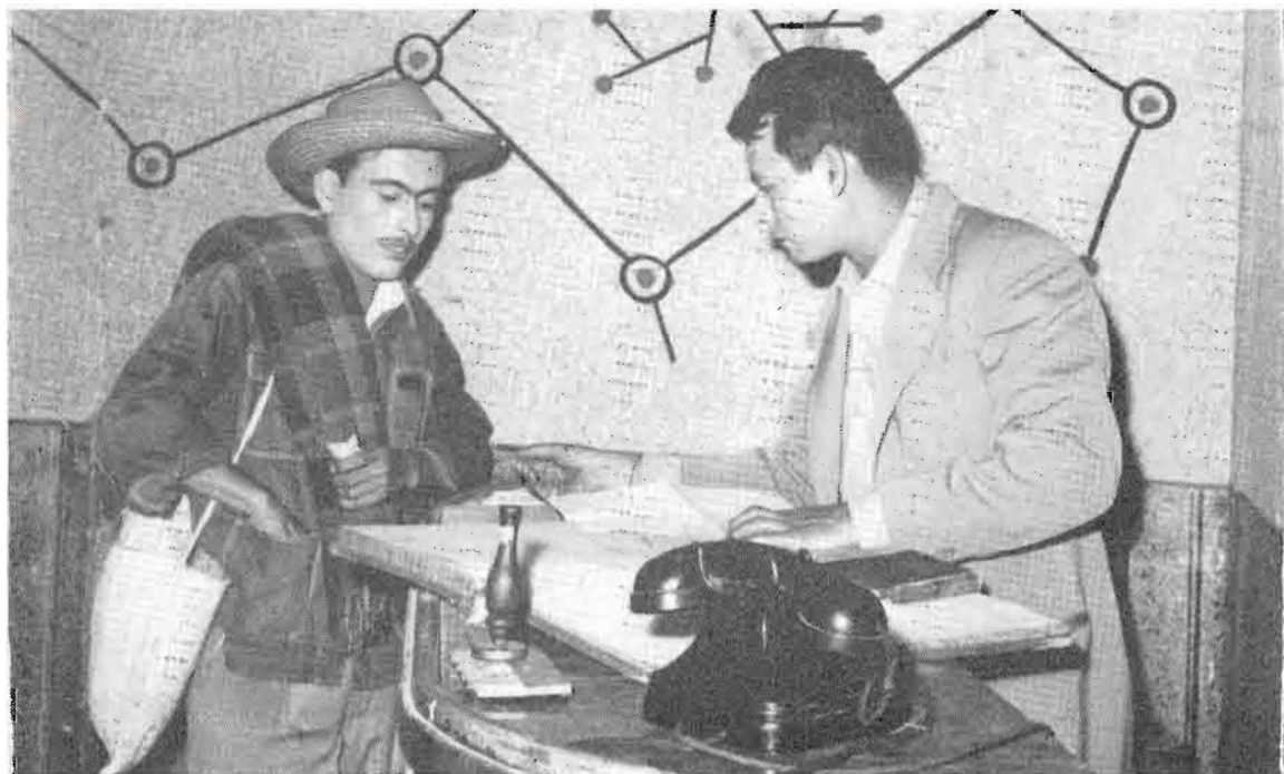
LOS COMEDIANTES y La Casona triunfaron en el Festival Nacional de Teatro 1956.