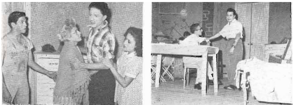
LOS COMEDIANTES presentaron obra inédita, en tanto, La Casona , puso a Villaurrutia.

SON LOS dos grupos más capaces y mejor dotados de la provincia: Oaxaca y Mérida.