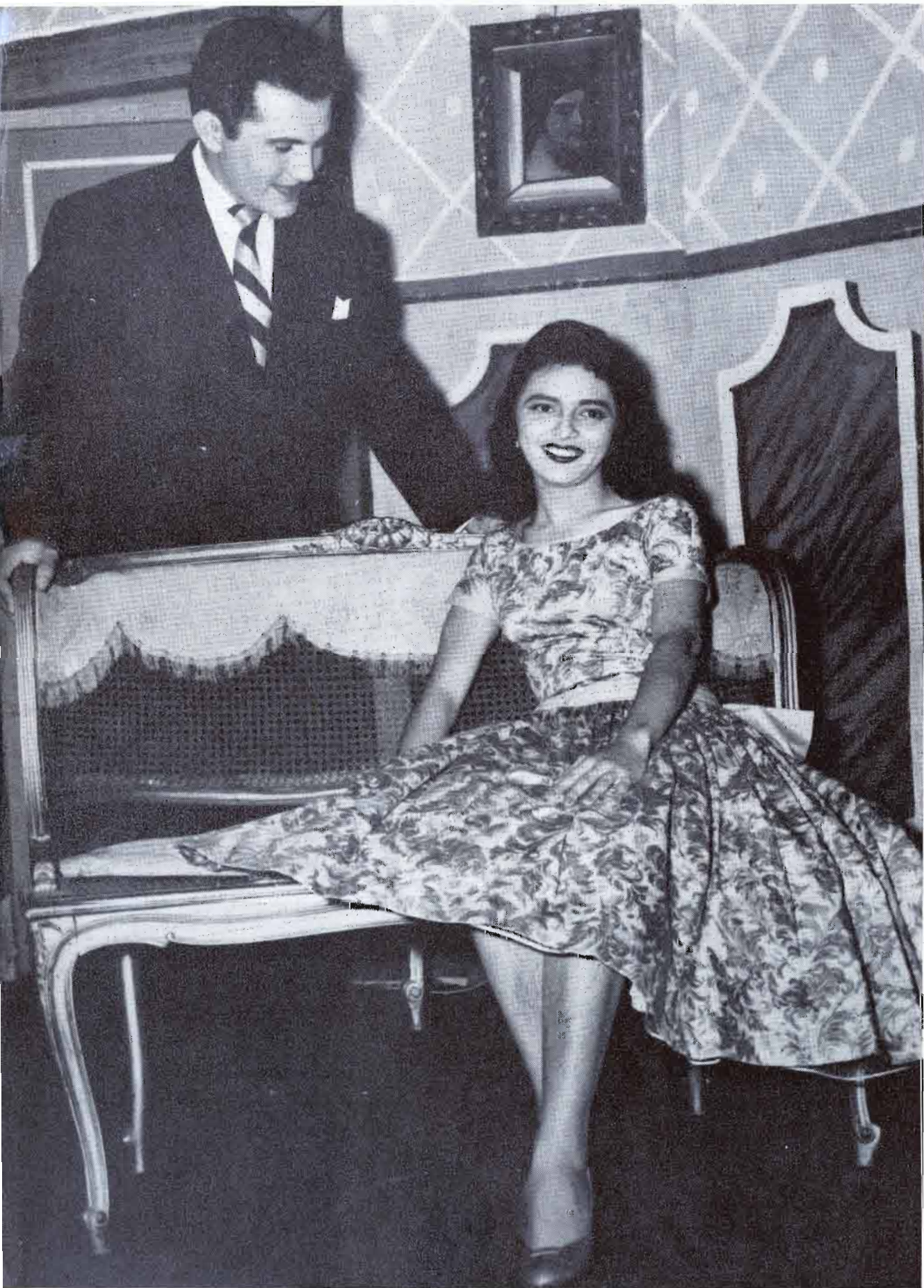
EL JURADO estimó que una de las finalidades es impulsar la producción artística nacional. LA INTERPRETACIÓN de La Mujer Legítima por parte de los yucatecos fue también excelente.

Quienes se interesan por la vida de provincia y sus expresiones naturales y estiman que allá están las mejores reservas de México y acaso el aspecto más representativo y caracterizado del ser nacional, habrán visto con agrado estas breves temporadas que el INBA presentó en la Sala del Seguro Social y en el Teatro Pánuco, respectivamente, como parte de una actividad que la Oficina de Teatro Foráneo está realizando en todo el ámbito nacional. El mayor mérito de todo ello radica no solamente en la circunstancia de ser un fruto de la cultura de provincia, sino en su intrínseca condición artística, en su calidad que aparece superior en cierto grado, en los dos grupos, a los que actúan en forma no profesional en la ciudad de México; al menos, muy dignos de hombrarse con los que aquí trabajan y desde luego merecedores de apoyo, de aplauso, de estímulo. Siendo el primer caso de grupos de provincia que realizan temporada en la capital, sin ningún antecedente que pueda servir de término de comparación, Los Comediantes y La Casona vienen a ser botones de muestra del muy firme y talentoso material humano que hay en provincia y de la nobleza de esta labor que realiza el INBA.