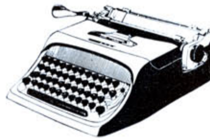
Olivetti Studio 44

La Studio 44 es una portátil que "rinde" como una máquina de despacho. Se traslada con facilidad, no estorba, ni requiere especiales cuidados.