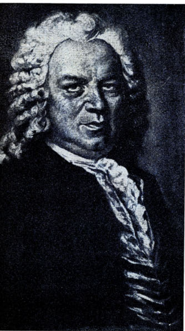
JUAN SEBASTIÁN BACH