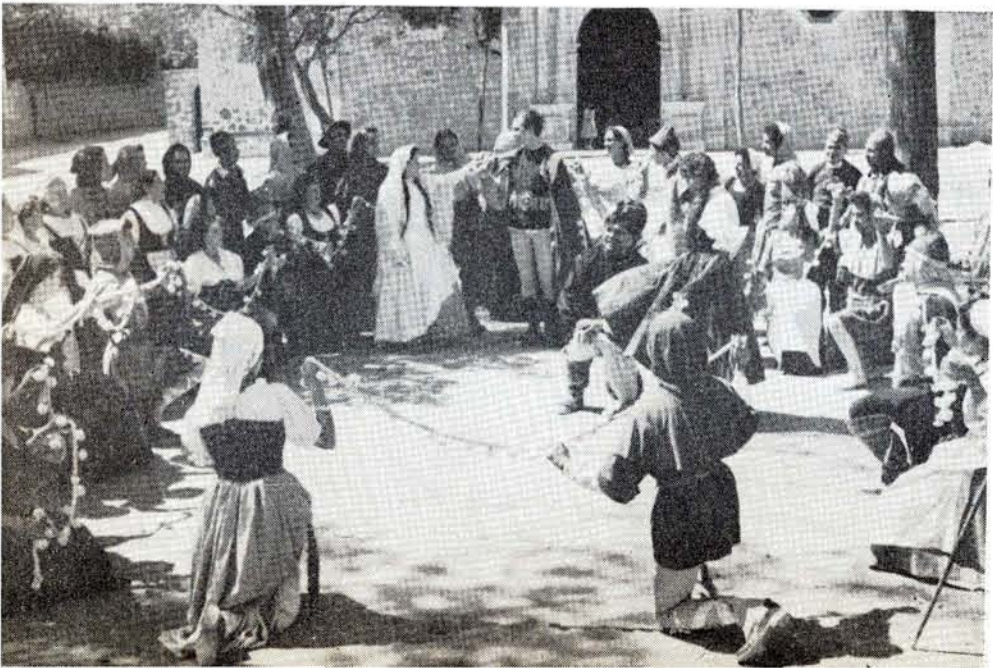
Y LA alegría volverá a reinar en Fuenteovejuna, libre ya de su tirano.