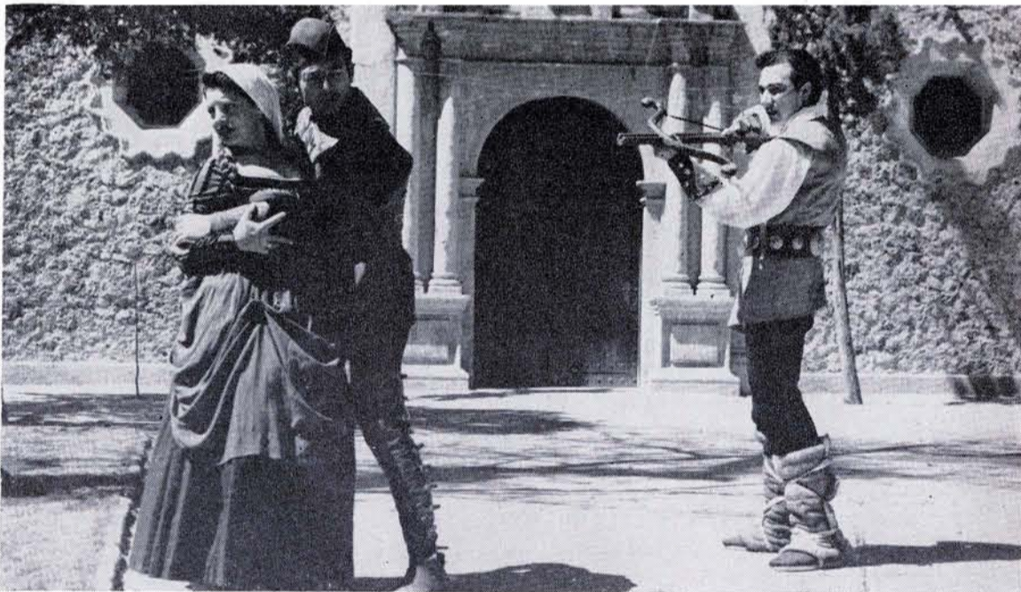
EL "BOBO" no ha confesado nada, pese a su cobardía natural.