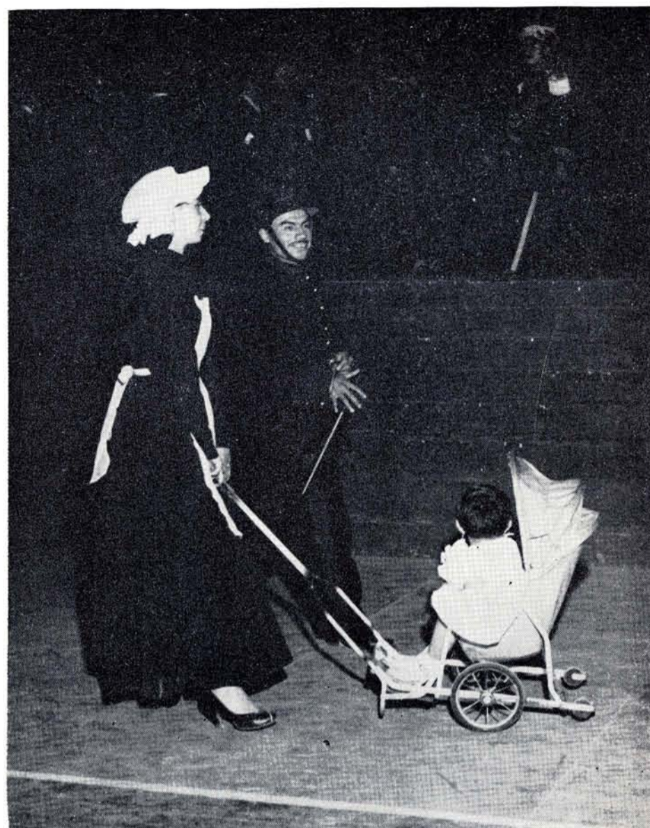
EN LAS Estampas de la Revolución se vió desfilas al México del pasado.