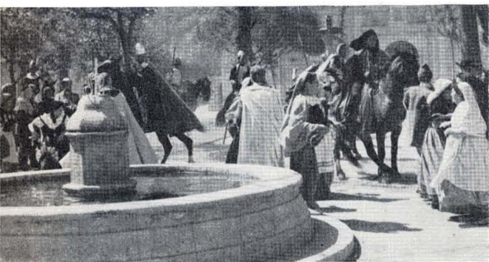
LOS CABALLOS en la escena dieron a ésta un realismo sorprendente, audaz.