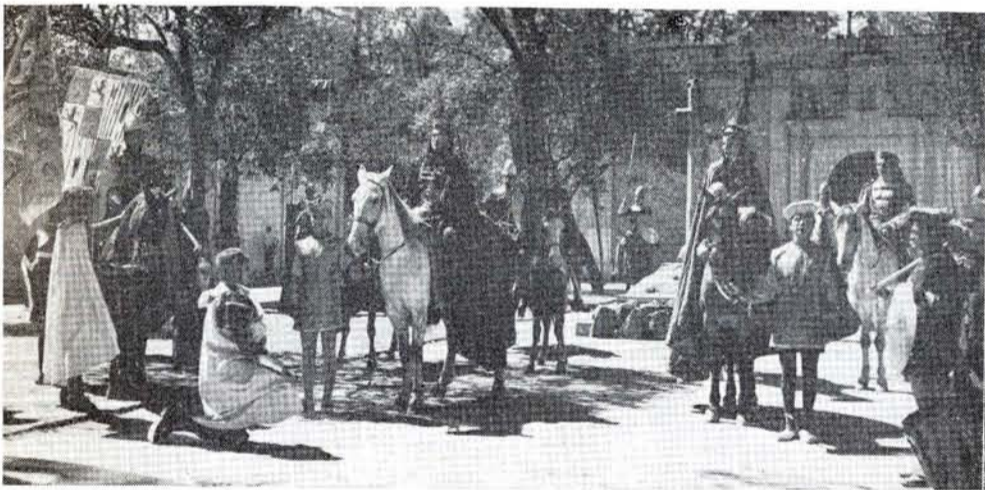
LOS REYES de Aragón y Castilla llegan por fin para perdonar al pueblo.