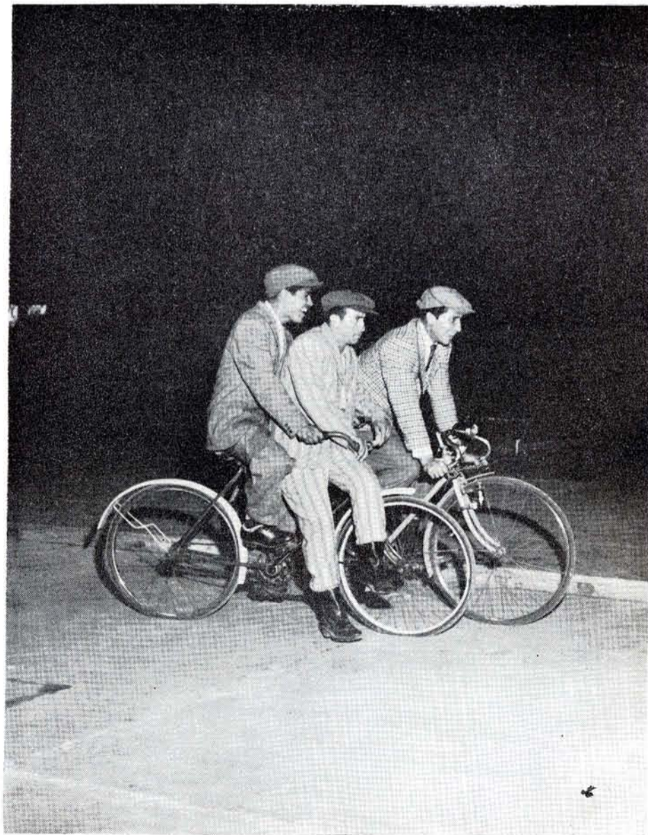
TODOS LOS momentos fueron representados con acierto y gracia.