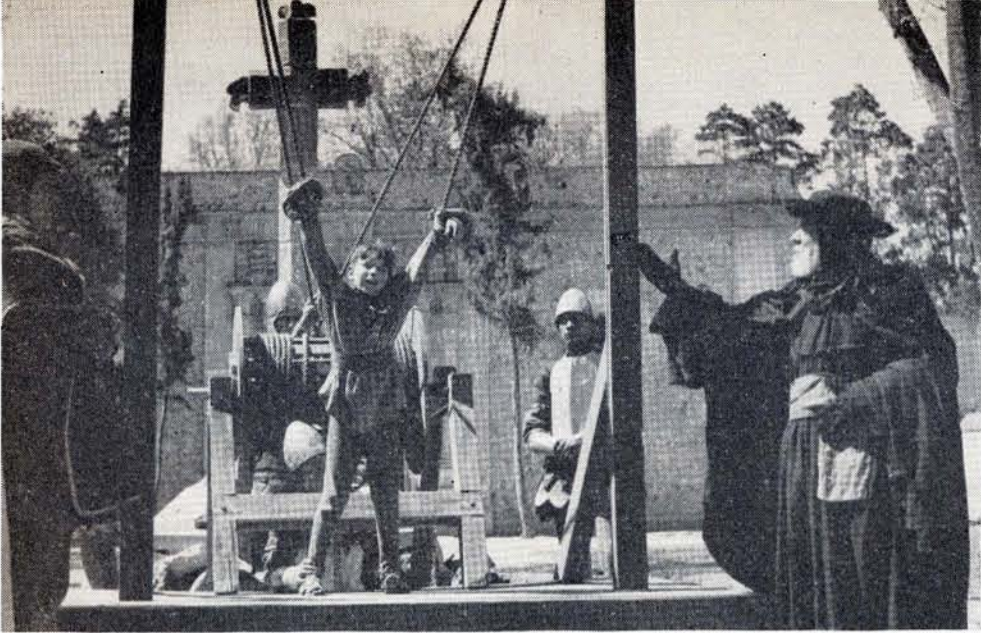
NI SIQUERA el niño se rinde al ser atormentado por el enviado regio.