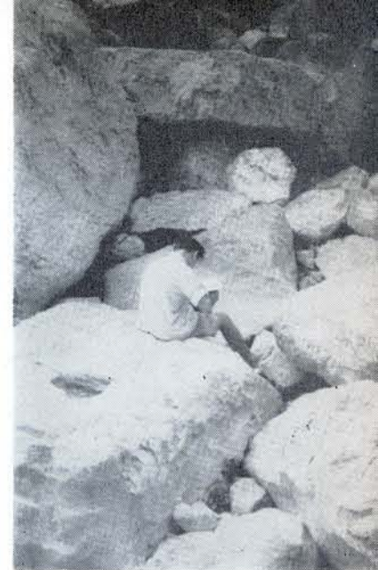
EL MEJOR maestro para la interpretación del paisaje.