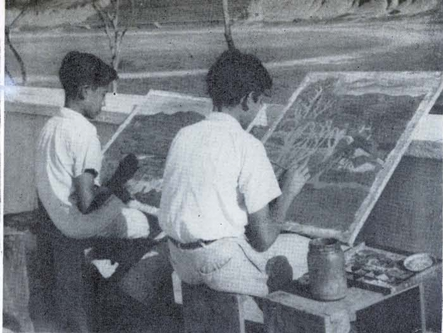
ANTE LOS monumentos de la cultura prehispánica, estudian.