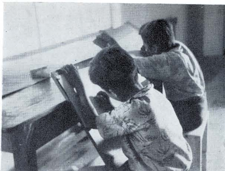
INICIACIÓN DESDE muy temprana edad...