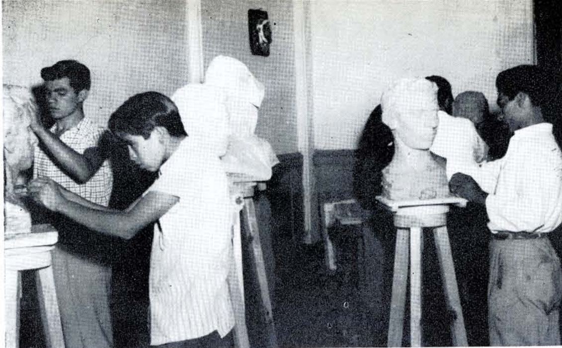
TALLER DE Escultura en el Instituto Potosino de Bellas Artes.

Por otra parte, se establecieron las escuelas de pintura al aire libre de Tula, Hgo., y el Taller Escuela de Gráfica y Pintura en Uruapan, Mich.