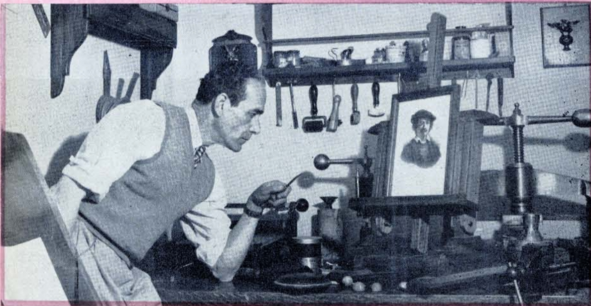
ASPECTO DEL TALLER de este notable artista mexicano.