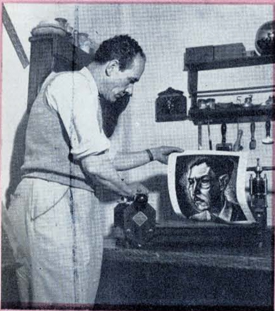
AQUÍ LA PRIMERA prueba impresa. ruev.