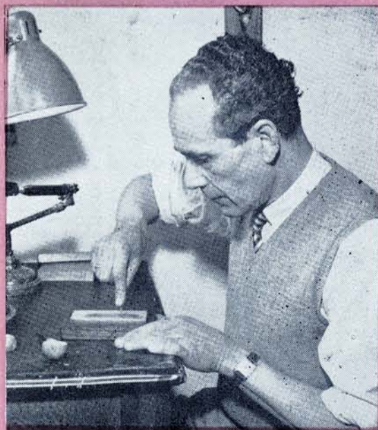
EL MAESTRO AFINA sus buriles.

N ació en La Piedad de Cabadas, Mich., el 14 de enero de 1905; llegó a la ciudad de México cuando era un niño y en ella realizó sus estudios primarios, terminados los cuales hizo su ingreso a la Escuela Nacional Preparatoria. Obedeciendo a los impulsos de su vocación, abandonó el recinto de San Ildefonso para inscribirse como alumno de la Academia de San Carlos, en donde permaneció seis años y terminó la carrera de grabador. Acumulaba entonces poco más de veinte años de edad.