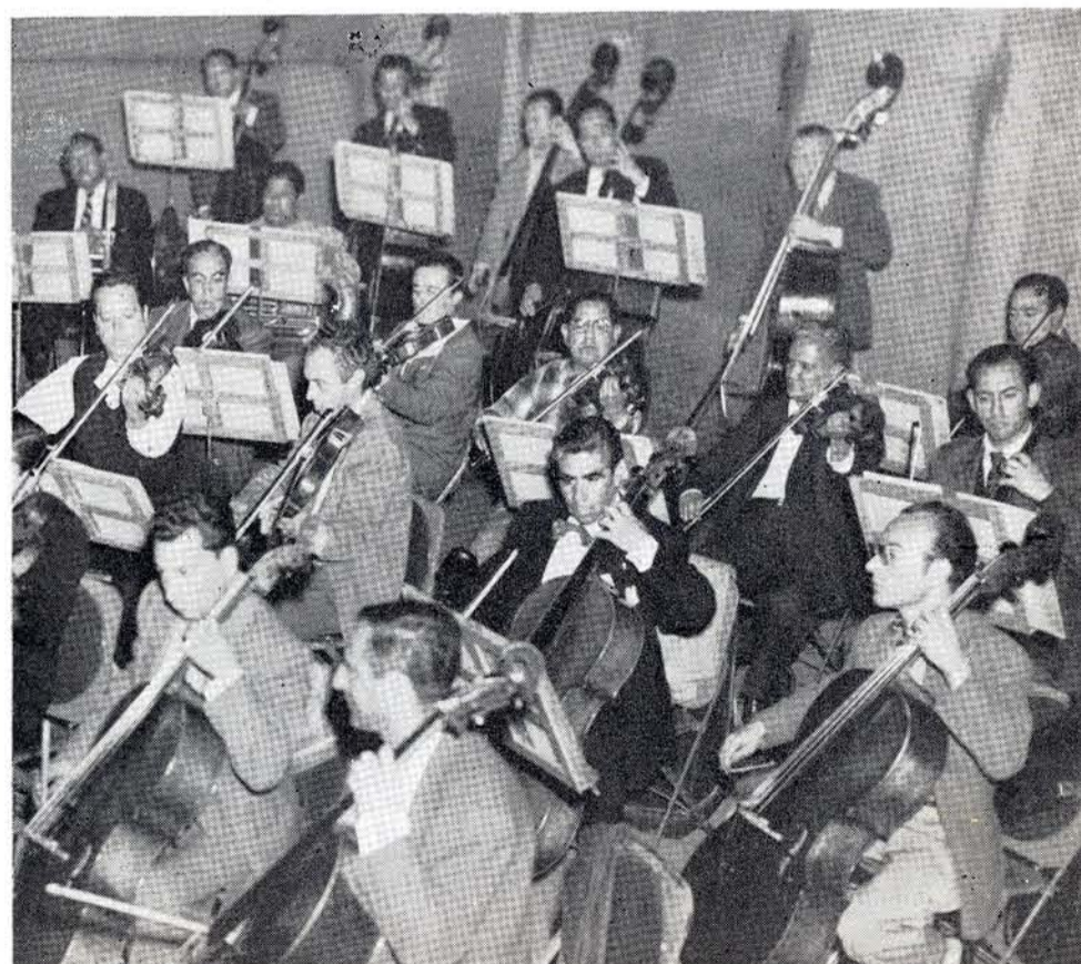
"HE SIDO invitado por varios países para dirigir diversas orquestas sinfónicas".