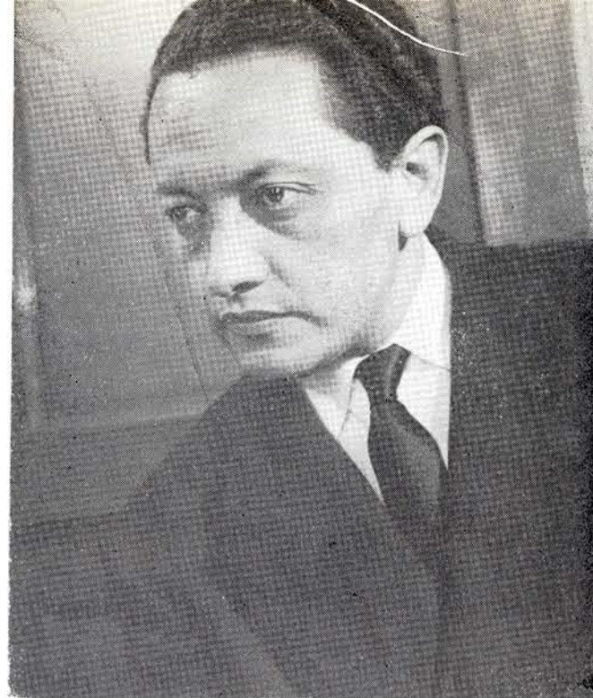
PÚBLICO difícil: el de mi ciudad.

—Entiendo que ayudaré en la promoción básica que hará el INBA, y que me encargaré de la organización general. Estoy convencido de que, de realizarse, estos cursos, darán prestigio a México, en el continente y fuera de él, con resonancias favorables en los principales centros musicales del mundo.