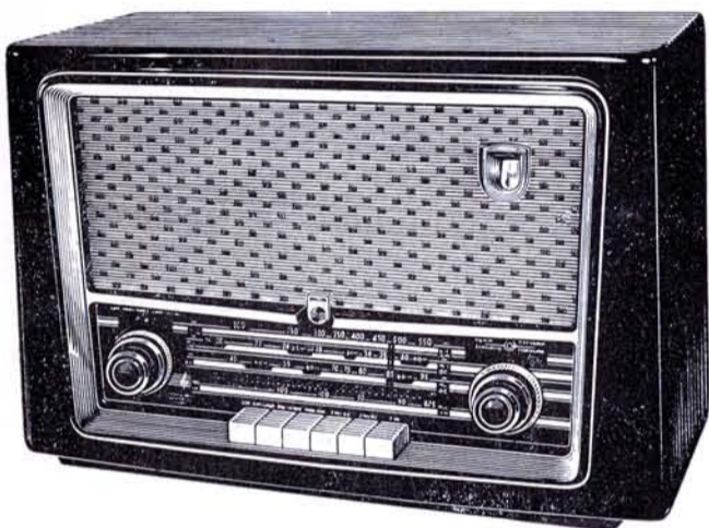
EL MAS NUEVO EN MEXICO DE LOS RADIORRECEPTORES DE FRECUENCIA MODULADA

Modelo BM-548-A. Este moderno aparato cuenta con 8 bulbos equivalentes a 12; 4 bandas: 1 de FRECUENCIA MODULADA, 1 de onda larga y 2 de onda corta; conexiones para antenas aéreas de FRECUENCIA MODULADA y de ondas larga y corta, bocina especial con respuesta de 30 a 16,000 ciclos para reproducción de alta fidelidad; conexiones para fonocaptor de alta fidelidad y para bocina adicional, en un elegante mueble de Philita, y antena especial para FRECUENCIA MODULADA. Precio de contado $ 1,695.00