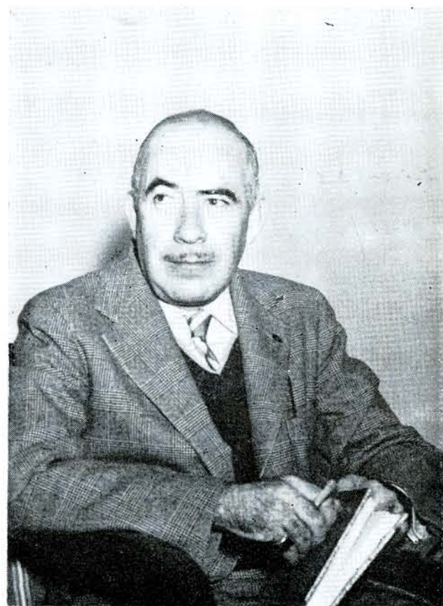
CORONA DE Sombra, El Gesticulador , El Niño y la Niebla , y muchas otras obras lo han situado en el primer lugar.

"Las modas pasan. Los directores desaparecen,