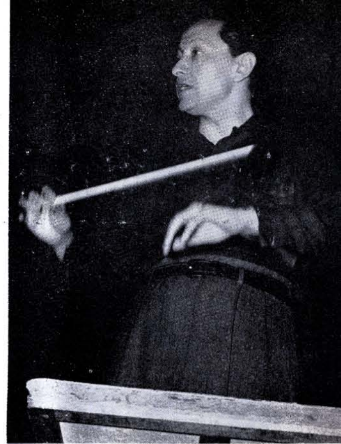
HERRERA DE la Fuente: Bruselas, Zürich, París.