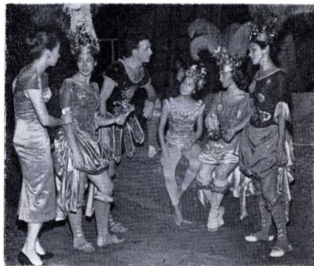
TONANTZINTLA: REPOSICIÓN es supervivencia.