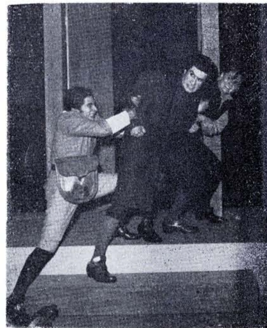
PRUEBA DE FUEGO superó todo lo previsto.