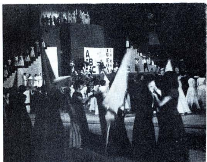
LA REVOLUCIÓN: el alfabeto para el pueblo.