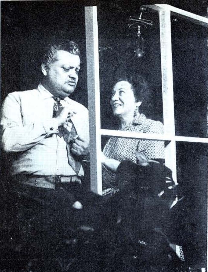
LOS DESARRAIGADOS: 200 representaciones.