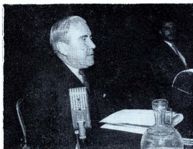
JOSÉ GOROSTIZA en un Viernes Poético.