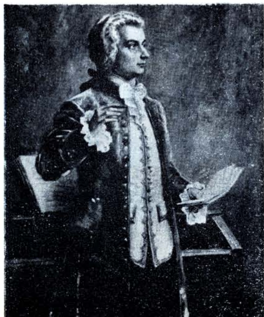
MOZART, EJE del año musical mexicano.