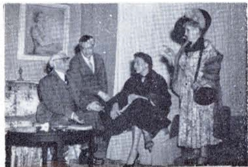
LA VENDA en los Ojos, no duró.