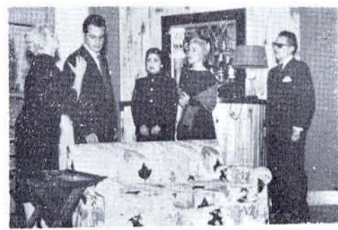
OBRA POLICIACA en el Caracol.

En junio el INBA estrenó Por Lucrecia (ver páginas interiores), de Giraudoux; el