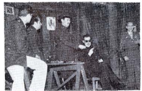
EL ARLEQUÍN ganó esta batalla.

vajon, con muy buen éxito; La Capilla continuó con A Ocho Columnas , de Novo; en el Teatro de la Comedia fracasó Zanza y los Maridos ; en el Globo la Unión de Autores abrió su temporada de Autores Mexicanos, y llevó a escena la obra de Federico Inclán,