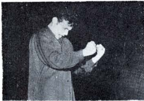
LORIN MAAZEL fogoso director.