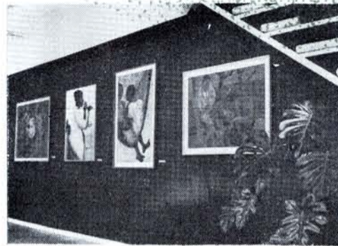
SALÓN DE la Plástica Mexicana.

EL SALON DE LA PLASTICA MEXICANA presentó una gran exhibición de acuarelas de Ignacio Beteta, a la que siguieron: Oleos de Gilberto Aceves Navarro, retratistas mexicanos