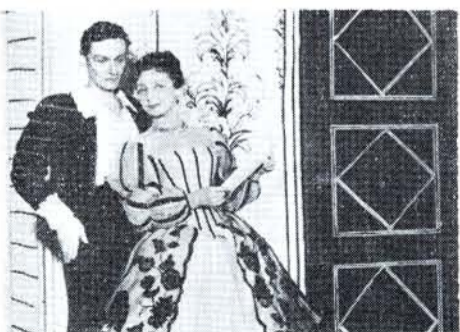
MADELEINE RENAUD y J. L. Barrault.