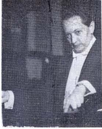
LUIS HERRERA DE LA FUENTE